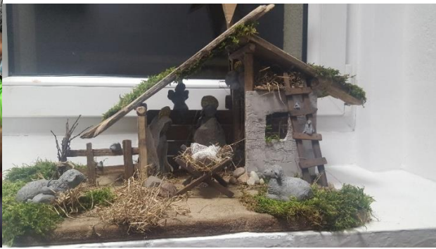
Jedna z laureatek