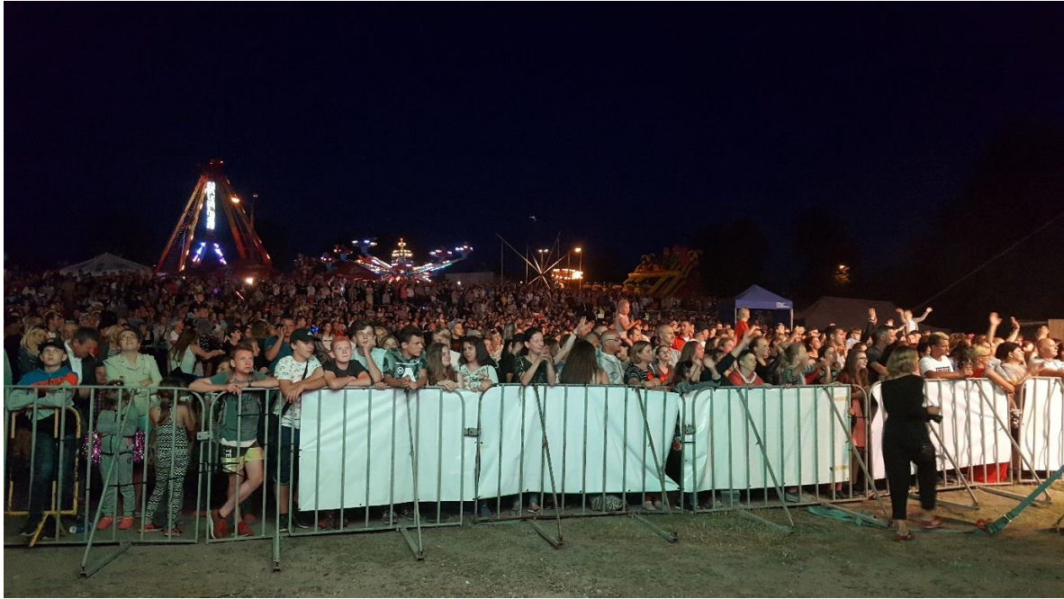
Widownia na plaży przy J. Biezdruchowo