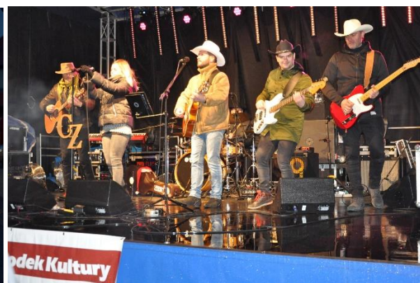
Występ zespołu country