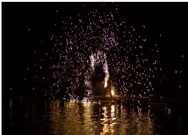
Teatr Ognia na wodzie