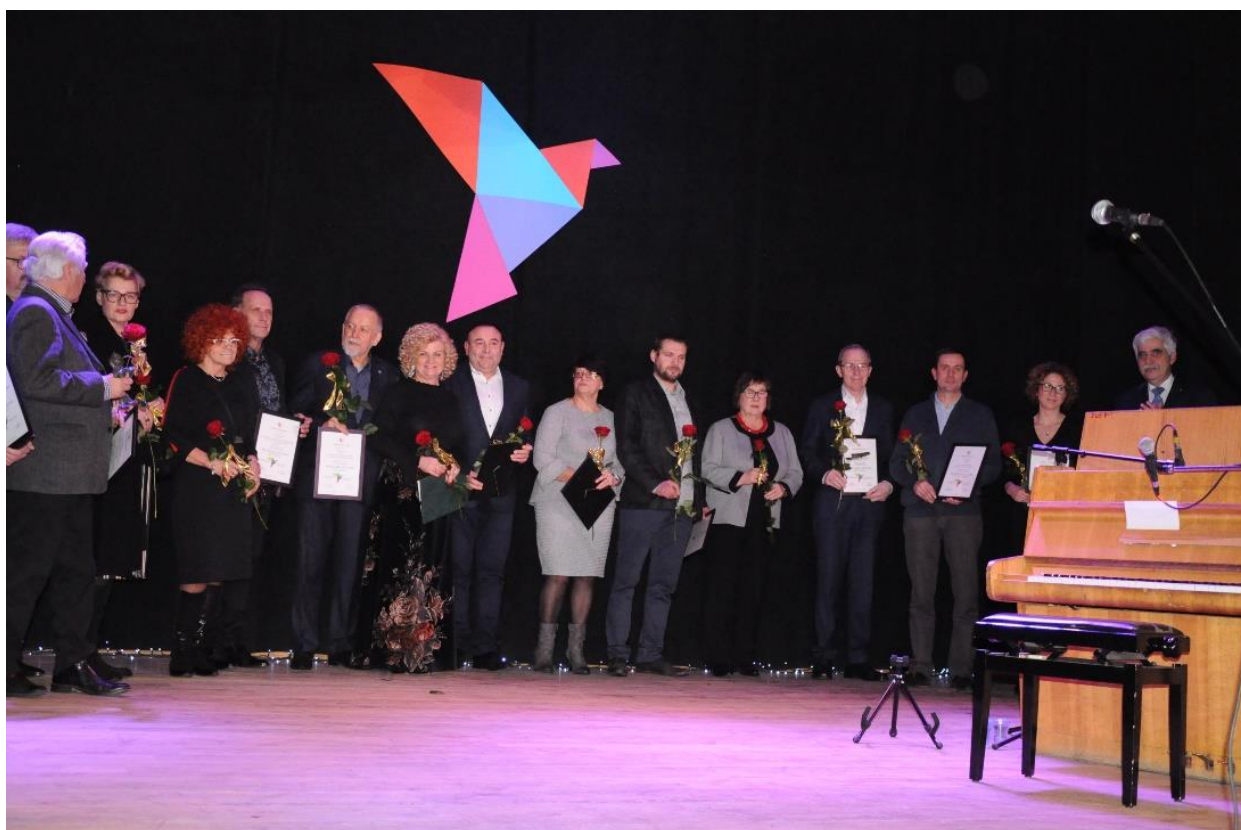
Przyjaciele Kultury za 2017rok