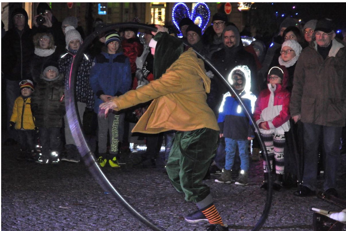
Kiermasz Bożonarodzeniowy – zabawy kuglarskie na Rynku