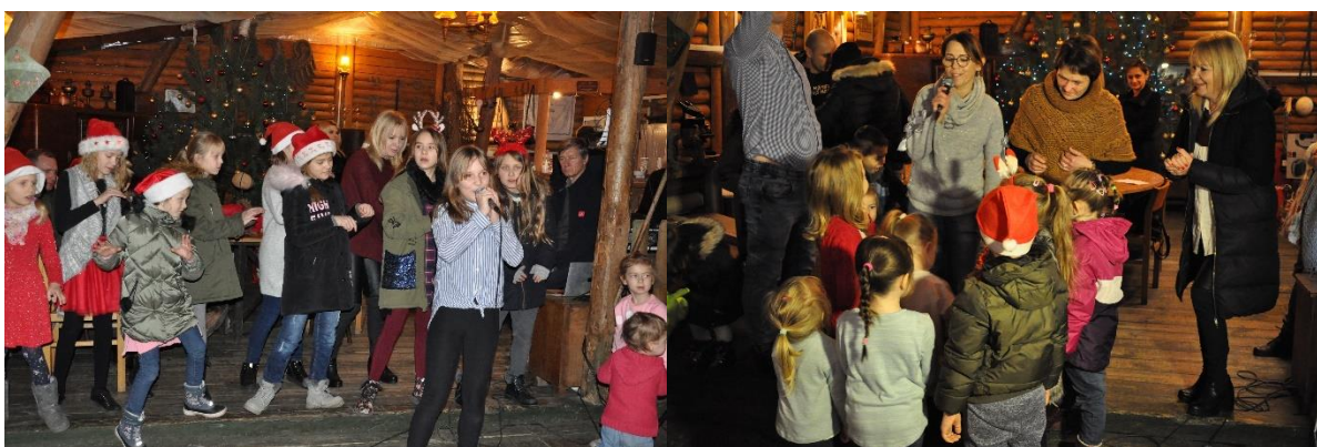
Mikołajki w Bednarach