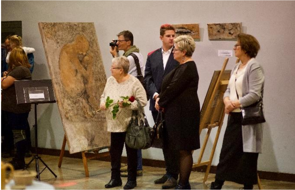
Wystawa malarstwa Agnieszki Hyjek-Linde