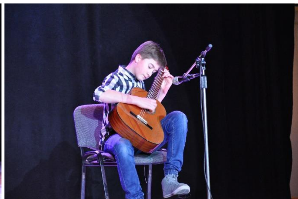
Pobiedziska Akademia Gitary – koncert