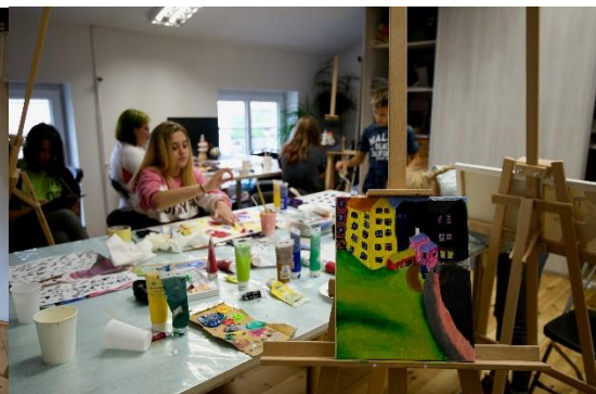
Wystawa poplenerowa młodzieży z gminy Pobiedziska