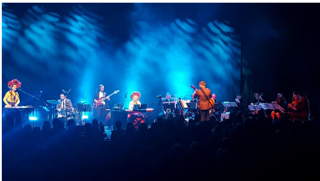
Koncert Daga Dana

Zaproszenie mieszkańców Pobiedzisk przez Fundację WezzArt z Poznania na KONCERT DAGADANA & Poznań Jazz Philharmonic Orchestra to dowód uznania dla działań artystycznych Pobiedziskiego Ośrodka Kultury. Fundacja WezzArt ufundowała 50 biletów oraz przejazd autokarem do centrum Kultury Zamek w Poznaniu na wyjątkowy koncert trwający prawie trzy godziny. Uczestnicy koncertu byli pod wrażeniem i dziękowali za możliwość udziału w tak wyjątkowym wydarzeniu kulturalnym.