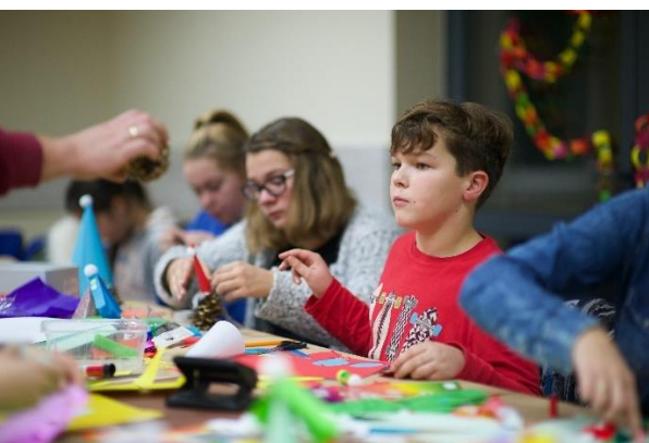
Warsztaty ozdób świątecznych w Kocanowie i Gołuniu