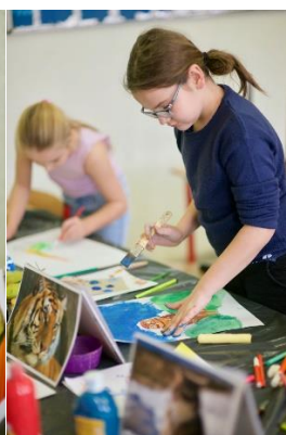
Pracownia Plastyczna POK

DZIEŃ DZIAŁACZA KULTURY – „Wesoły Autobus” - obchodzony po raz pierwszy wspólnie z mieszkańcami.