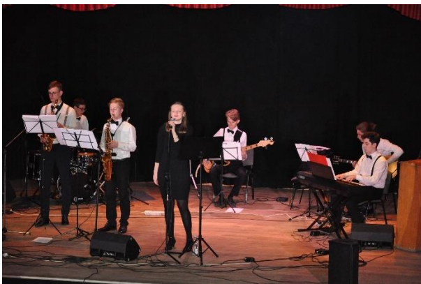
Jazz Band – Her Majesty's