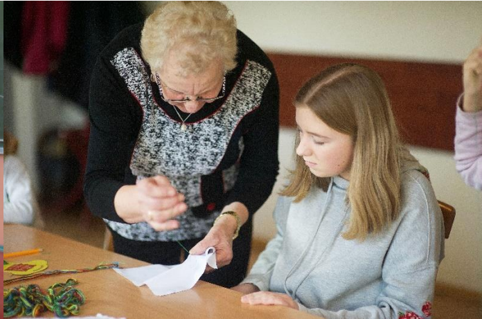
Malowane igły – zajęcia manualne