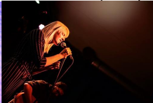
Koncert Helain Vis