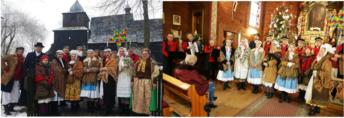
Koncert kolęd w sąsiedzkiej Gminie Łubowo