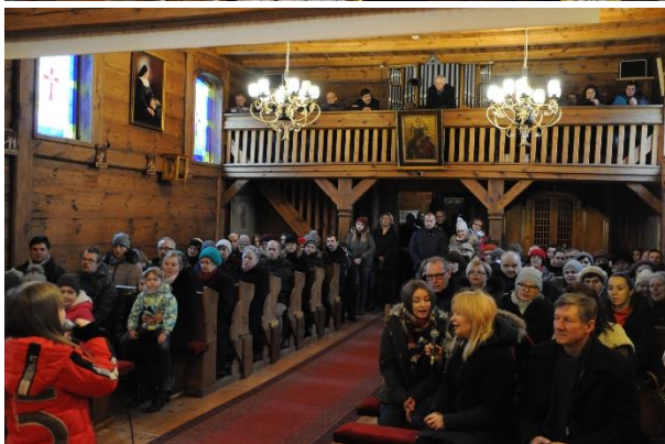
Koncert kolęd Studia Piosenki w Węglewie