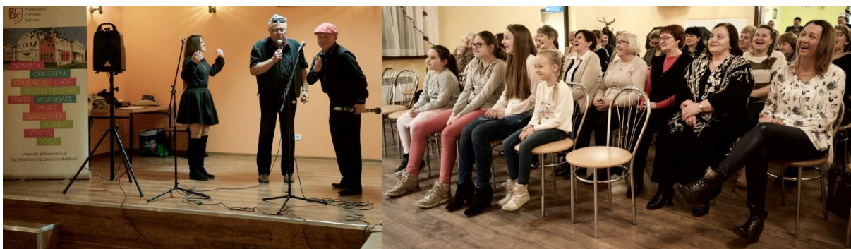
Kabaretowo w sołectwach

W celu integracji mieszkańców sołectw zorganizowano wycieczkowy weekend „Niezwykłe Miejsca Polski”. Mieszkańcy sołectw gminy Pobiedziska spędzili czas w Trójmieście jednym z najciekawszych miejsc na polskim wybrzeżu.