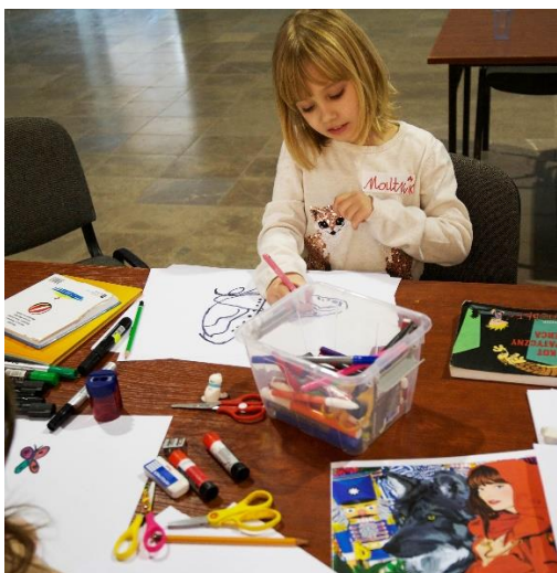
Warsztaty komiksu i improwizacji