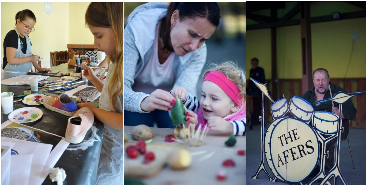
Malowanie tramppek-warsztaty Stęszewko ŚWIĘTO PYRY -Stęszewko