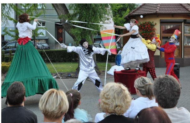
Spektakl „Ukryte” Wykonanie: Teatr Łata, Teatr Gili, Gili i Teatr Hom