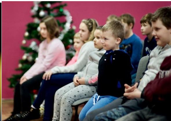
Mikołajki w Węglewie