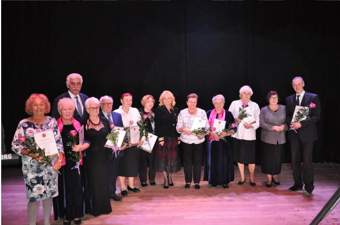
Uroczystość Jubileuszowa- wyróżnieni działacze na rzecz ruchu seniorskiego