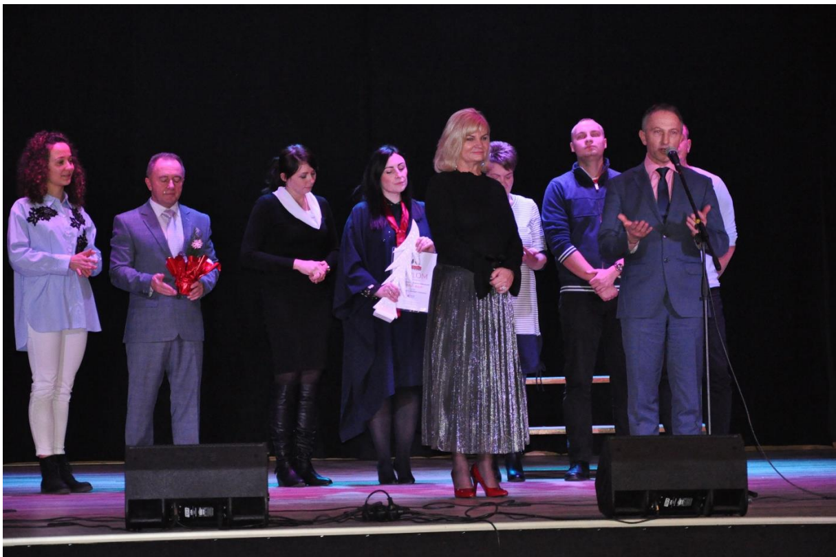
Przeгляд „Hej kolęda, kolęda”