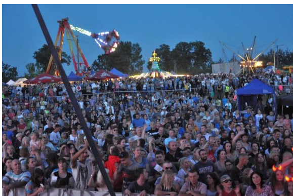
Fantastyczne Wesołe Miasteczko