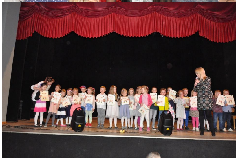
Finaliści Festiwalu Przedszkolaków