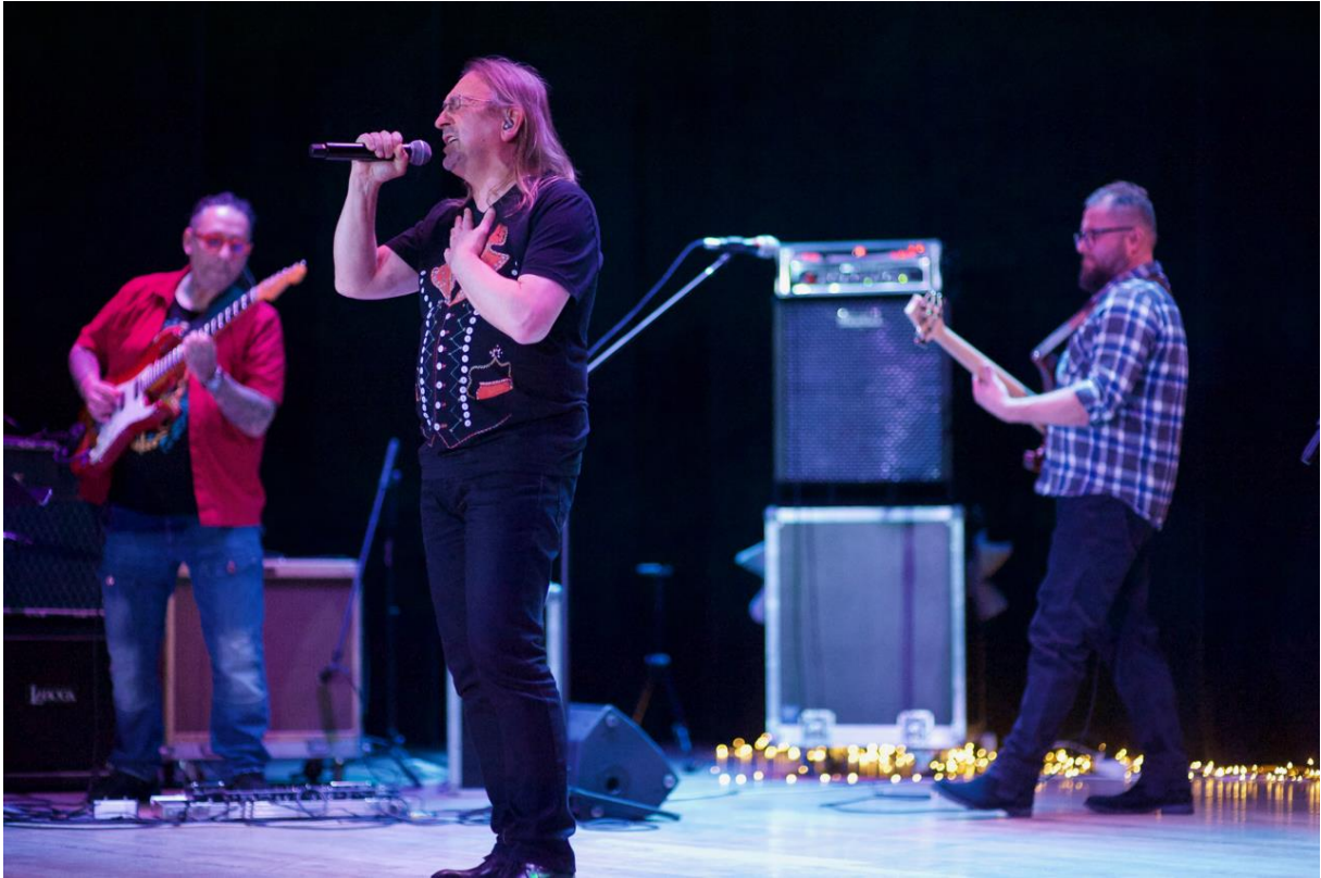
Marek Piekarczyk z zespołem Ajagore

26 października odbył się wyjątkowy koncert legendarnego wokalisty grupy TSA Marka Piekarczyka z zespołem Ajagore. Wokalista zaprosił na wyjątkową, przekrojową podróż po swoich muzycznych dokonaniach i inspiracjach w 40-stoletniej działalności scenicznej.