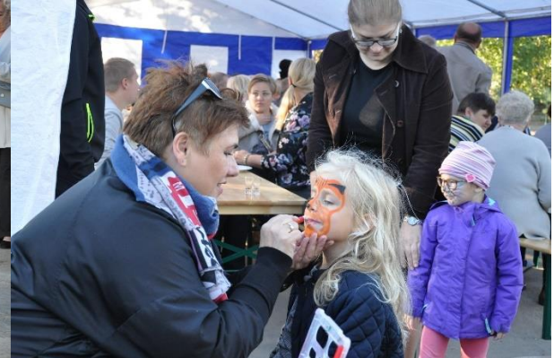
Otwarcie świetlicy w Gołuniu