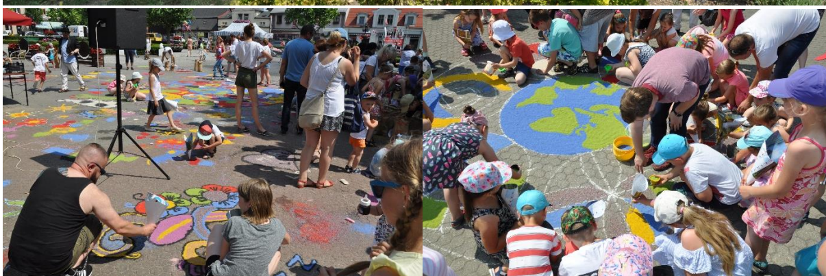
Malarze Ulotni – sypanie piaskiem– Dzień Dziecka na Rynku

MALARZE ULOTI to zaskakujące wydarzenie. Zarówno dzieci jak i dorośli szybko zatracili się we wspólnym sypaniu piaskiem kolorowych mandali. Ciekawym jest fakt, że każdy mógł stworzyć swoją własną część, która była składową większej, barwnej całości. Po pełnej skupienia pracy nastąpiło - zgodnie z wcześniejszą zapowiedzią - żywiołowe wytarzanie się w piasku i bezpowrotne zniszczenie - wszak to sztuka ulotna.