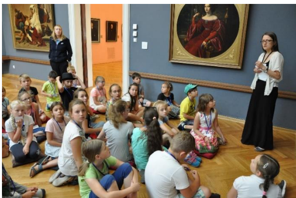
lekcja w muzeum