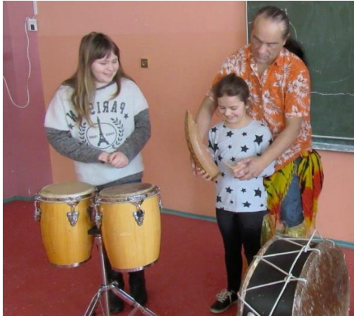
Podróże muzyczne HOTU MATU