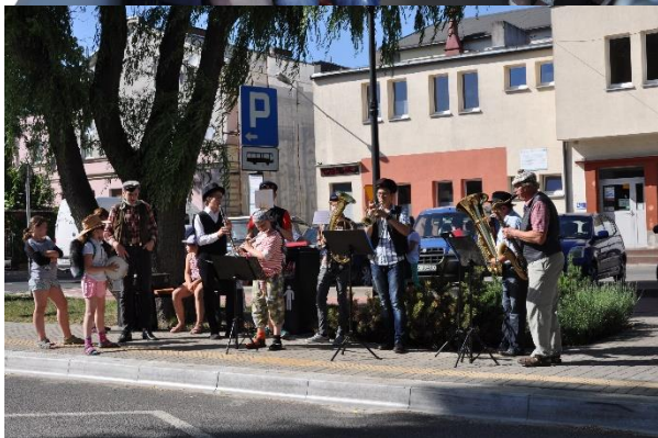
Dzień Działacza Kultury