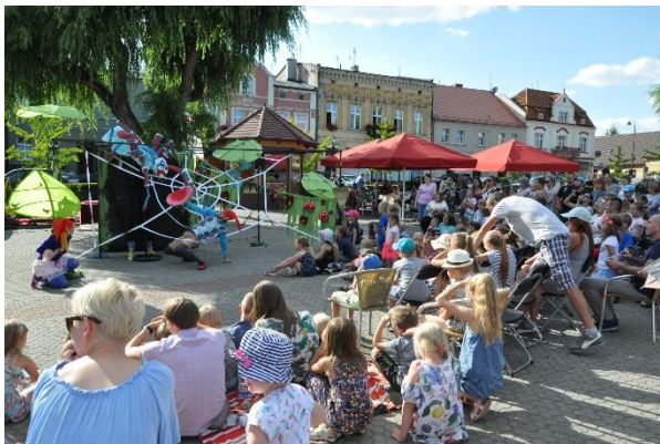
Teatr w Małym Mieście-spektakl „Polowanie na motyle”