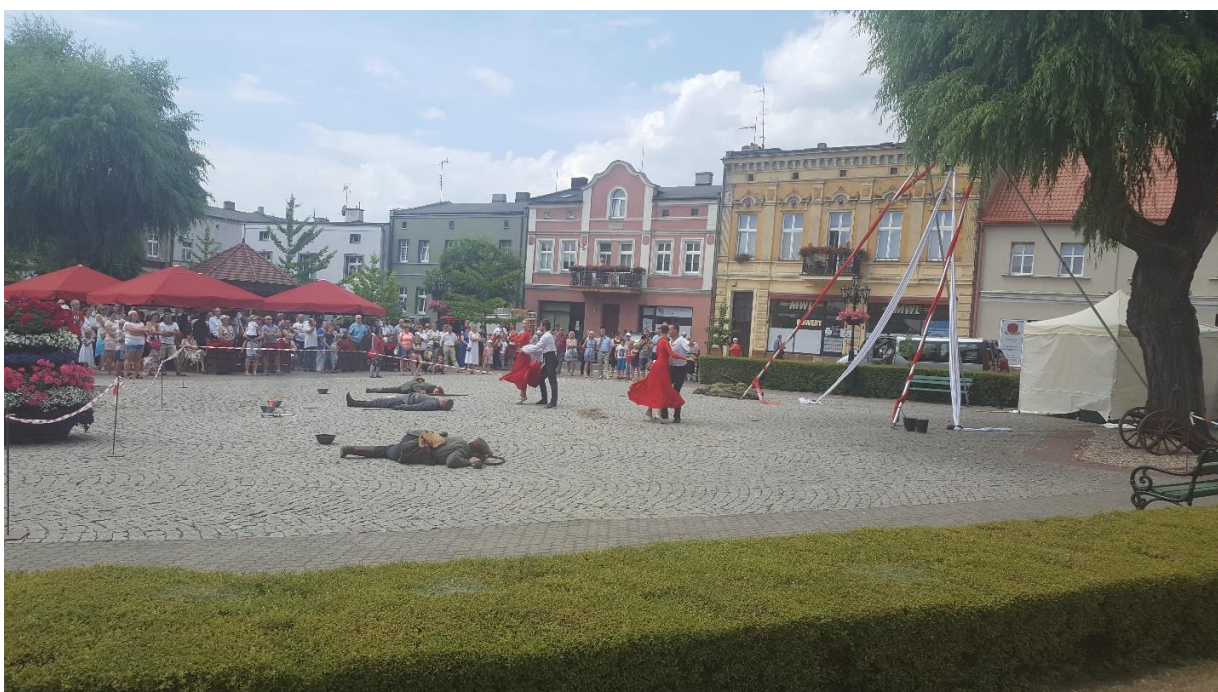
Widowisko „PAMIĘĆ” - Rynek

W drugim dniu Jarmarku Piastowskiego chcąc uczcić 100-lecie Odzyskania Niepodległości i 100-lecie Powstania Wielkopolskiego, zostało przedstawione widowisko "PAMIĘĆ" w wykonaniu artystów Teatru Wielkiego z Poznania. Spektakl rozpoczął się po mszy o godzinie 12 gdzie mieszkańcy po wyjściu z Kościoła spotkali się z grupą żołnierzy w asyście 2 aniołów na szczudłach zachęcających wszystkich do udania się w stronę Rynku. W trakcie marszu widzowie byli częścią wydarzeń. Po przejściu na Rynek słychać było odgłosy bitwy, żołnierze walczyli z niewidzialnym wrogiem. Strzał armatni przerwał bitwę zabijając wszystkich uczestników. Po czym rozległa się muzyka wraz z którą zjawily się Anioły przywracające do życia każdego z walczących, w efektowny sposób przekazano wspomnienia oraz wartości patriotyczne poległych walczących. Efektem końcowym było spalenie zastony symbolu niewoli po czym wyłonił się biały orzeł.