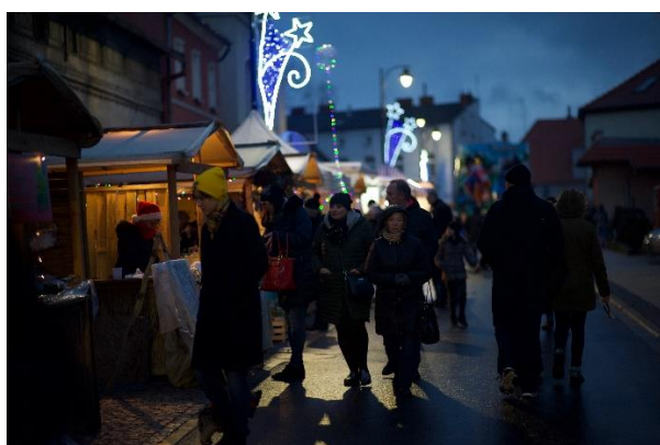
Na deptaku z produktami świątecznymi