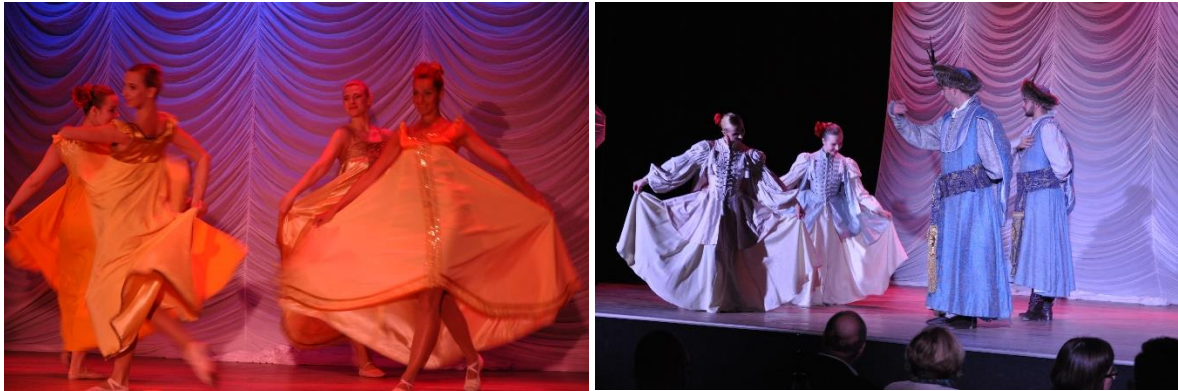
Szlaki Pamięci- widowisko