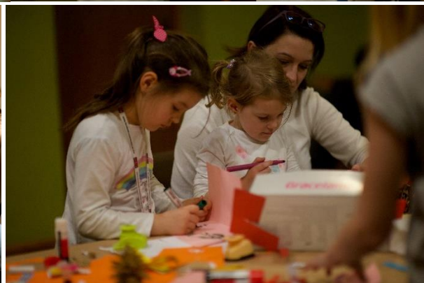
TEATRYLE i warsztaty robienia ozdób w sołectwach