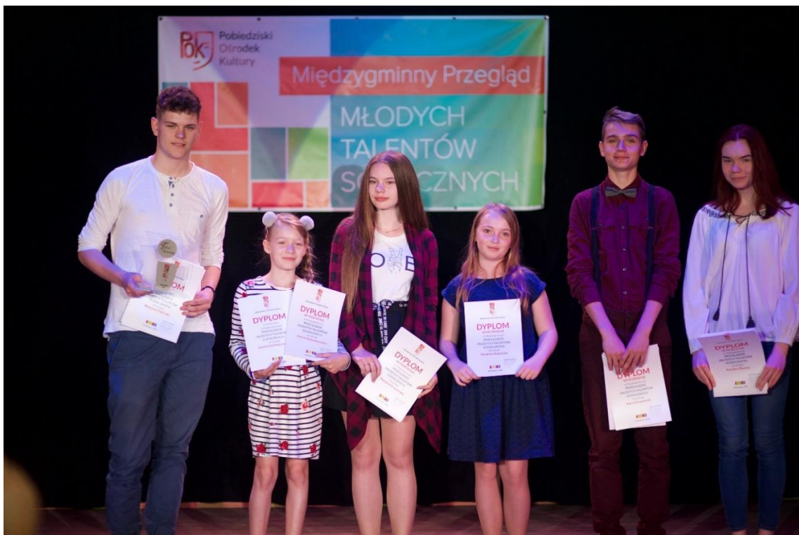
Młode Talenty 2018- Laureat i wyróżnieni