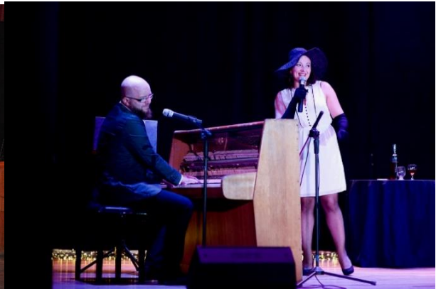
Cztery Strony Kobiety- recital