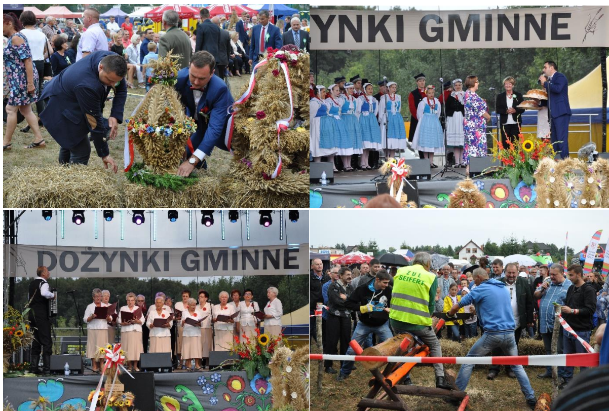
Dożynki Gminne - Biskupice