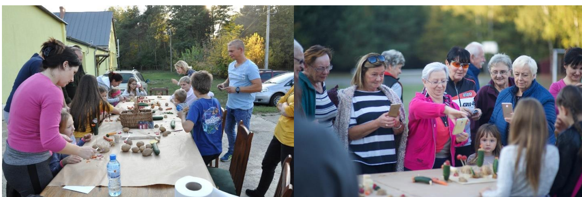
Święto Pyry – Stęszewko