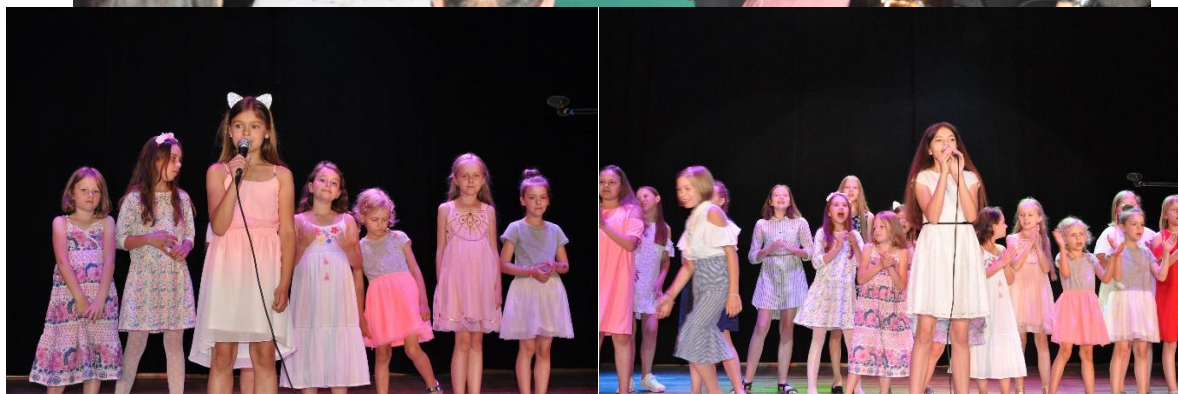
Zakończenie sezonu artystycznego – koncert Studia Piosenki