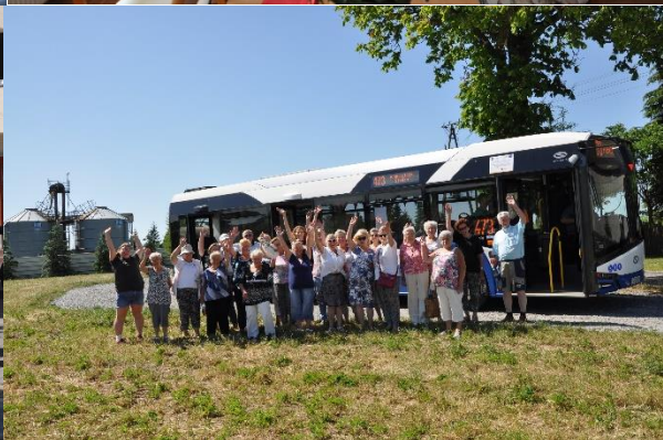
Wesoły Autobus po gminie