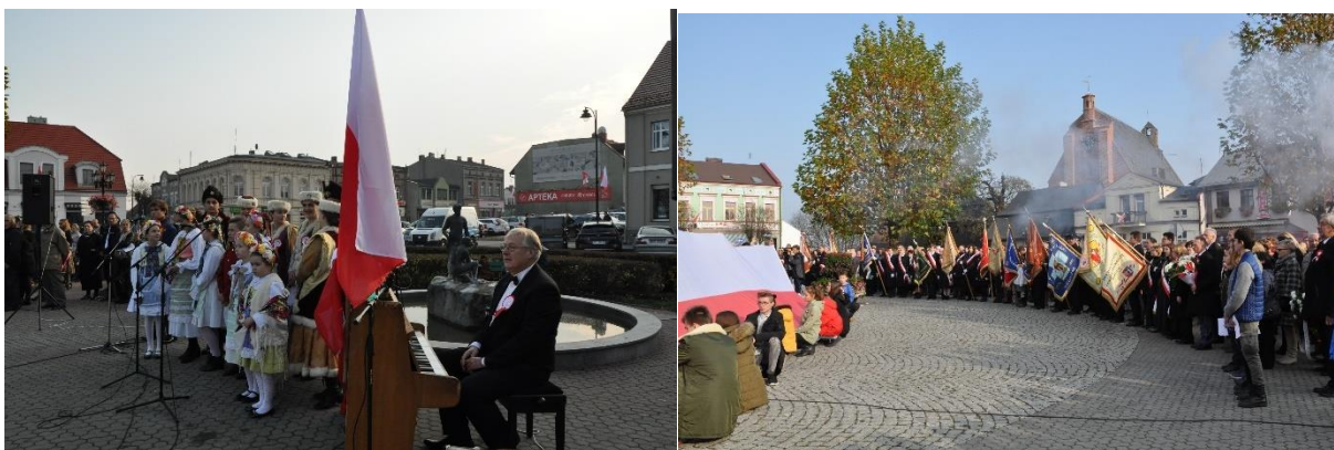
100-lecie Odzyskania Niepodległości – 11 listopada