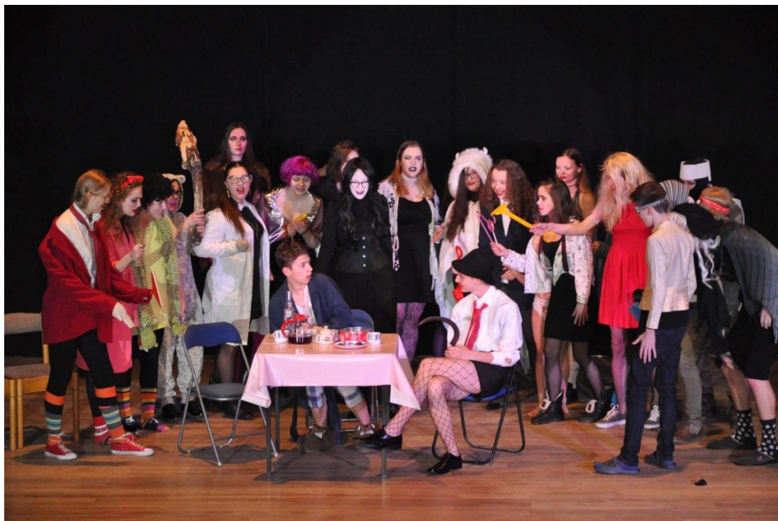
Spektakl SWATKA w wykonaniu uczniów i absolwentów Szkół Muzycznych z Poznania.