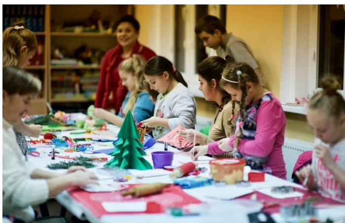
Mikołajki w Kocanowie