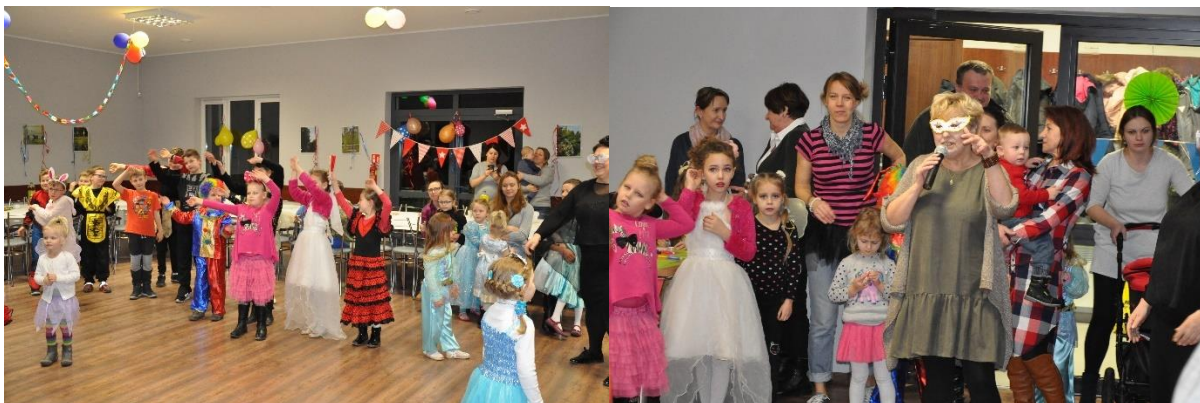
Balik Karnawałowy-Kociałkowa Górka