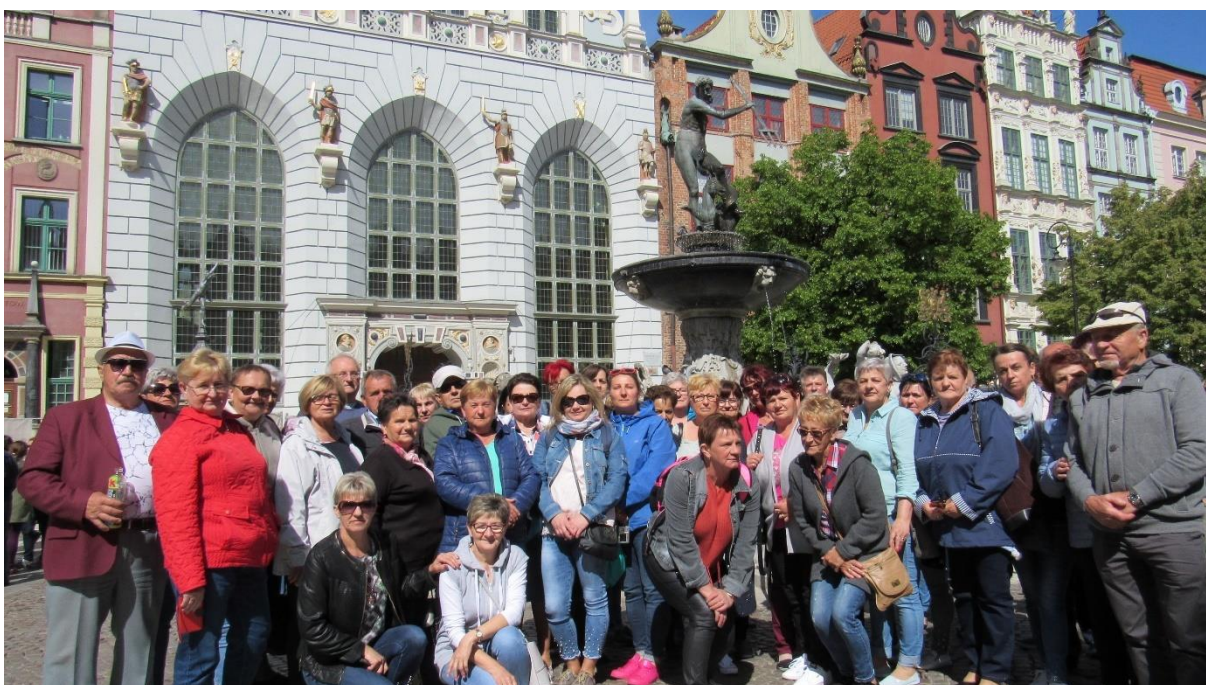
Wycieczka do Trójmiasta mieszkańców sołectw

W celu integracji mieszkańców sołectw zorganizowano wycieczkowy weekend „Niezwykłe Miejsca Polski”. Mieszkańcy sołectw gminy Pobiedziska spędzili czas w Trójmieście jednym z najciekawszych miejsc na polskim wybrzeżu.