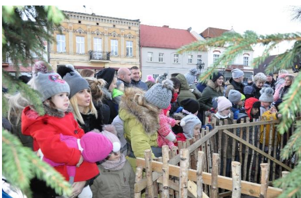
Żywa szopka – śpiewanie kolęd na Rynku.