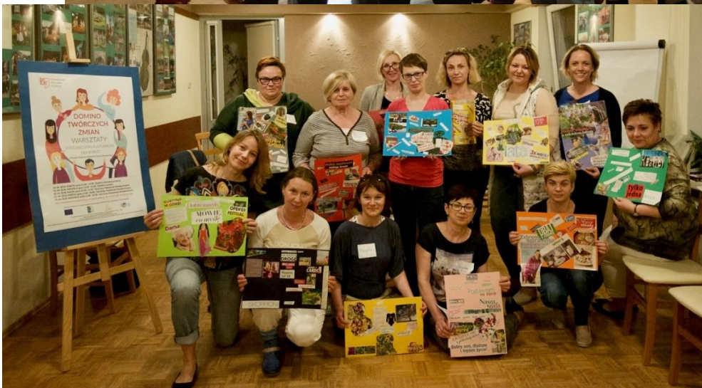
Domino Twórczych Zmian