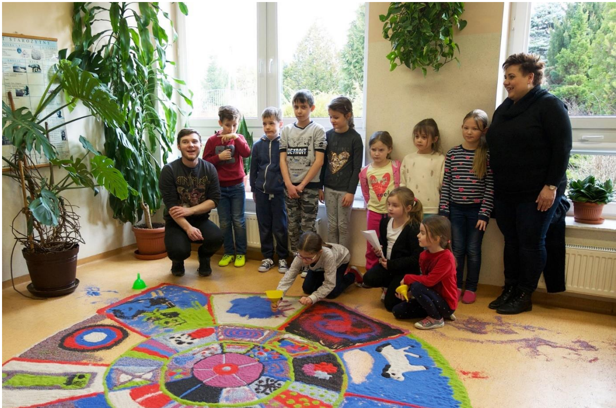
Malarze Ulotni w świetlicach